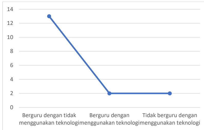
RAJAH 3. Bilangan artikel yang dianalisis berdasarkan tema