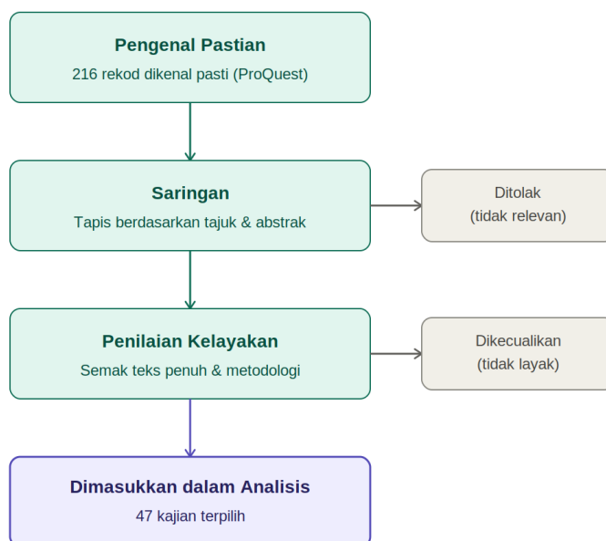
Rajah 1: Aliran Proses Pemilihan Kajian